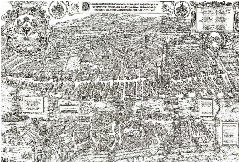
Der Murerplan ist ein Holzschnitt der Stadt Zürich des Zürcher Glasmalers und Kartografen Jos Murer aus dem Jahr 1576.